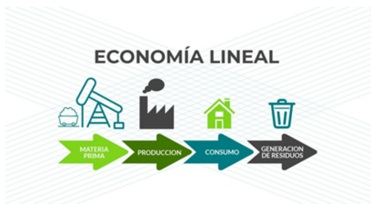
FIG. 1 Esquema Economía Lineal

La reducción del impacto medio ambiental y la contaminación es fundamental para que tanto los seres humanos, como animales o cualquier forma de vida, puedan seguir viviendo en equilibrio con el medio ambiente. Ante todos estos problemas, la solución que se demanda ante el escenario que se encuentran requiere un CAMBIO inminente de la ECONOMÍA LINEAL hacia la ECONOMÍA CIRCULAR.