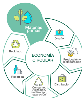
FIG. 2 Esquema Economía Circular 1

A diferencia del modelo de economía lineal tradicional que se basa en el concepto de “usar y tirar”, la ventaja de cambiar los procesos para implantar una economía circular es la armonización entre los recursos necesarios para la vida y la pervivencia del medio ambiente.